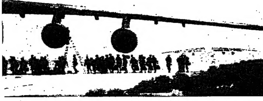
وصول دفعة جديدة من القوات الاميركية الى السعودية